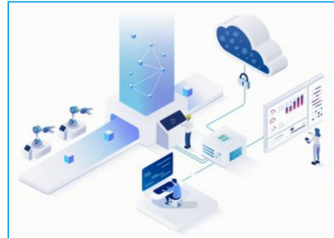
Zur FORCAM Plattform-Lösung für das IIoT